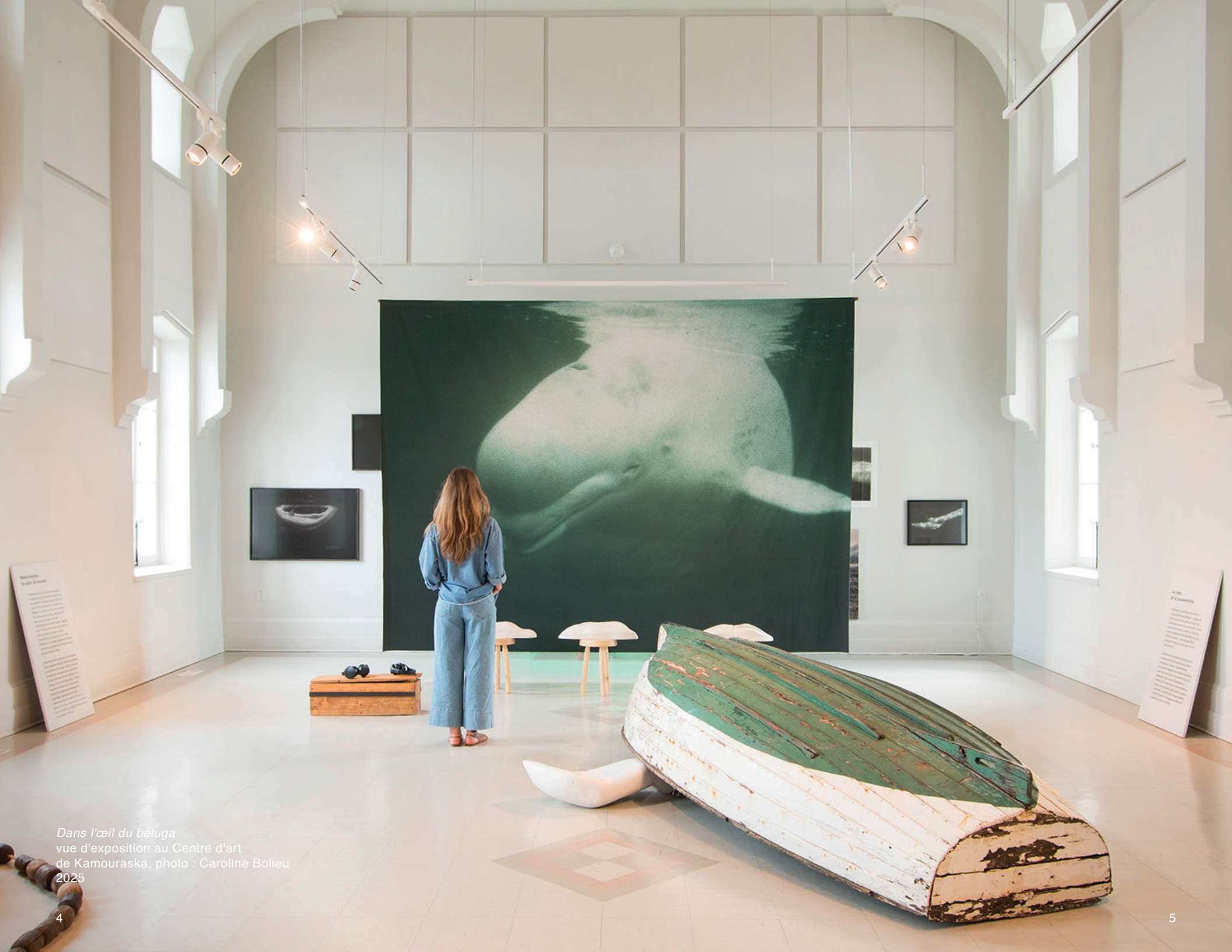
Dans l'œil du béluga vue d'exposition au Centre d'art de Kamouraska