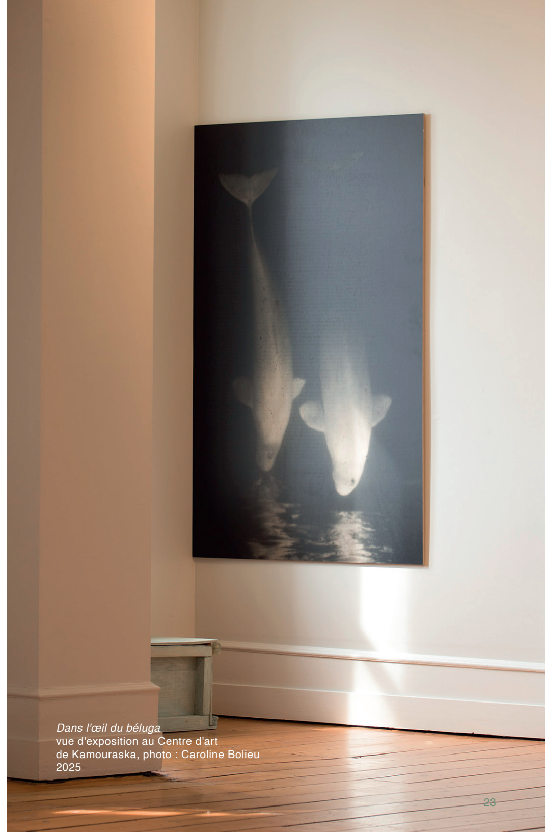
Dans l'œil du béluga vue d'exposition au Centre d'art de Kamouraska